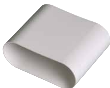
Manguito macho 40x100 mm