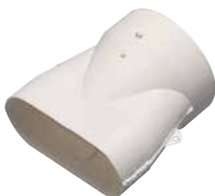
Manguito mixto para conducto Ø80 mm