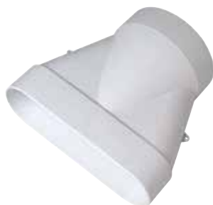
Manguito para conducto