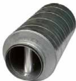
OCTA con baffle diámetro 250 con Junta

El silenciador OCTA con baffle atenúa muy fuertemente la propagación acústica (medias y altas frecuencia) en una red circular.