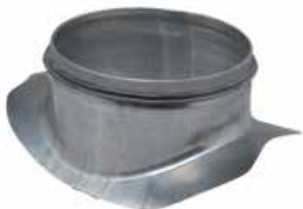
Injerto Escuadra Circular con juntas

El injerto escuadra circular con juntas permite realizar un injerto a 90° sobre un conducto circular galvanizado.