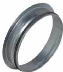
Injerto Escuadra sobre Cara Plana con juntas

El injerto escuadra sobre cara plana con juntas permite realizar un injerto a 90° sobre un conducto de tipo oblongo o rectangular galvanizado.