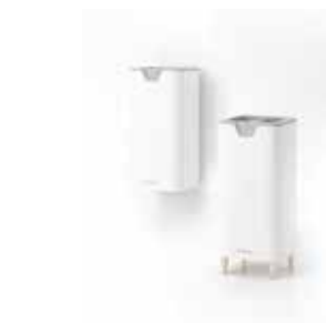
Alana de pared

Alana™, el purificador de aire compacto y eficaz con el coste de utilización más bajo del mercado.