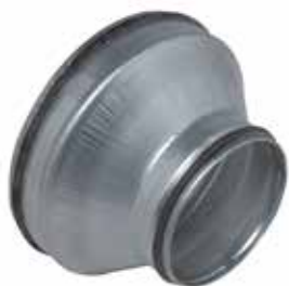
Reducción Cónica Concéntrica con juntas

La RCC con juntas permite conectar dos conductos galvanizados de diámetros diferentes entre sí asegurando al mismo tiempo una estanqueidad clase C.