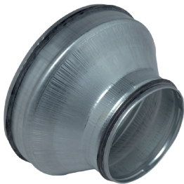
Reducción Cónica Concéntrica con juntas

La RCC con juntas permite conectar dos conductos galvanizados de diámetros diferentes entre sí asegurando al mismo tiempo una estanqueidad clase C.