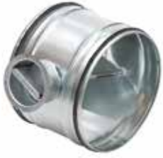
Compuerta RG con juntas

La compuerta RG con juntas permite equilibrar una red circular garantizando al mismo tiempo una tasa de fuga muy baja de clase D (hasta Ø315 inclusive) o clase C (a partir de Ø355).