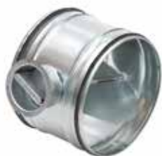
Compuerta RG con juntas

La compuerta RG con juntas permite equilibrar una red circular garantizando al mismo tiempo una tasa de fuga muy baja de clase D (hasta Ø315 inclusive) o clase C (a partir de Ø355).