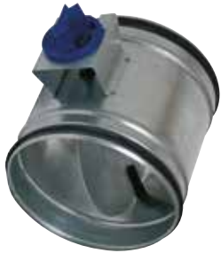
Compuerta RG con juntas

La compuerta RG con juntas permite equilibrar una red circular garantizando al mismo tiempo una tasa de fuga muy baja de clase D (hasta Ø315 inclusive) o clase C (a partir de Ø355).