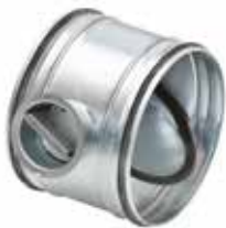
RGE con junta manual

La compuerta RGE permite equilibrar y aislar manualmente una red circular garantizando al mismo tiempo una tasa de fuga muy baja.