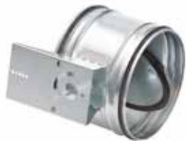
RDEM con junta motorizable

La compuerta RGE Motorizable permite equilibrar y aislar con un motor una red circular garantizando al mismo tiempo una tasa de fuga muy baja.