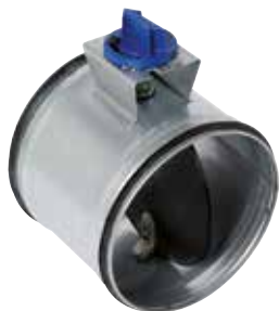
RGE con junta manual y motorizable

La compuerta RGE equilibra y aísla manualmente con sin motor una red circular garantizando al mismo tiempo una tasa de fuga muy baja.