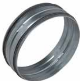
Manguito Macho con juntas

El manguito macho con juntas permite conectar dos conductos galvanizados entre sí asegurando al mismo tiempo una estanqueidad clase C.