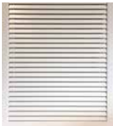
Rejilla de retorno T.One® AquaAIR/T.One® AIR