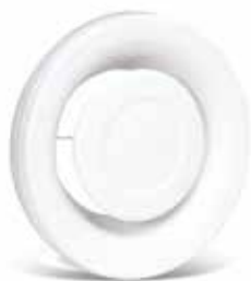
SR 143 Ø200

La boca de núcleo SR 143 de acero con caudal regulable in situ asegura el retorno de aire.