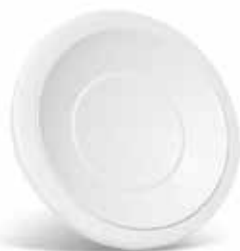
SR 145 Ø200

La boca de núcleo SR 145 de acero con caudal regulable in situ asegura la impulsión de aire.