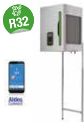
T.One® AIR 04 réversible R32

La solución innovadora y a medida para calentar o refrigerar su vivienda confortablemente.