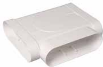
Te 90° horizontal