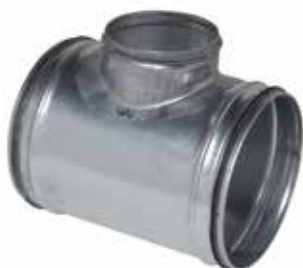
Te 90° con juntas

La TE 90° con juntas permite conectar dos conductos galvanizados con un ángulo de 90°, asegurando al mismo tiempo una estanqueidad clase C.