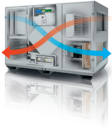
Visualización de los flujos de aire dentro de una VEX500