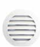
Viserilla EHT2-EFT2 Blanco