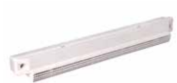
Viserilla acústica antimosquitos

Viserilla acústica antinsectos para EHL, EA y EHB2 - Blanco