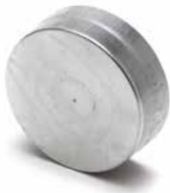
Tapa Macho Hembra

La tapa macho hembra permite taponar un conducto o un accesorio de acero galvanizado en los locales terciarios y en las viviendas colectivas.