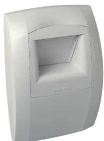
Bahia Curve cocina

La boca higrorregulable para cocinas BAHIA CURVE L permite garantizar una extracción suficiente y permanente de contaminantes interiores en función del grado de humedad de la estancia.