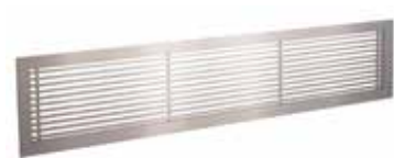
Rejilla GRIDLINED wall

La rejilla interior fija de aluminio GRIDLINED Wall está destinada a la impulsión y retorno del aire en los edificios terciarios.