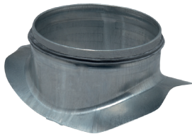
Injerto Escuadra Circular con juntas

El injerto escuadra circular con juntas permite realizar un injerto a 90° sobre un conducto circular galvanizado.